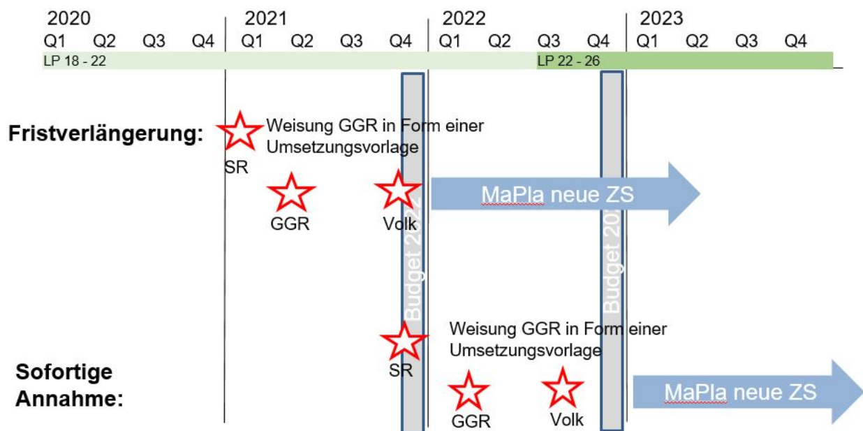
Abbildung 2: Vergleich Fristverlängerung und sofortige Annahme der Motion bezüglich der Umsetzung möglicher neuer Massnahmen.

Die Vorteile dieses – auf den ersten Blick vielleicht etwas umständlichen – Vorgehens liegen auf der Hand. So kann nicht nur sichergestellt werden, dass alle zuständigen politischen Instanzen in Kenntnis aller Fakten einen fundierten und kohärenten Entscheid zur zukünftigen Energie- und Klimapolitik der Stadt Winterthur fällen können. Es resultiert auch ein Zeitgewinn von mindestens einem halben Jahr gegenüber der „regulären“ Behandlung einer Motion, wo dem Stadtrat nach deren Erheblicherklärung anderthalb Jahre Zeit gewährt wird, um der Motion zu entsprechen (vgl. Art. 67 Abs. 9 Geschäftsordnung), was wiederum eine schnellere Umsetzung von neuen Massnahmen ermöglichen würde: Falls der Grosse Gemeinderat im Januar 2021, in Kenntnis des Energiekonzepts sowie des Massnahmenplans, den Antrag des Stadtrates bezüglich Anpassung der Zielsetzung bzw. des behördenverbindlichen Grundsatzbeschlusses annimmt und zeitnah zuhanden des zur Zielanpassung nötigen Volksentscheides freigibt, könnten allfällige neue Massnahmen bereits im Jahr 2022 umgesetzt werden. Bei einer direkten Annahme der Motion könnten Ressourcen zur Umsetzung erst für das Jahr 2023 beantragt werden. Eine Fristverlängerung ermöglicht somit gegenüber einer direkten Annahme der Motion einen Zeitgewinn von einem Jahr bezüglich der Umsetzung von neuen Massnahmen (siehe Abbildung 2).