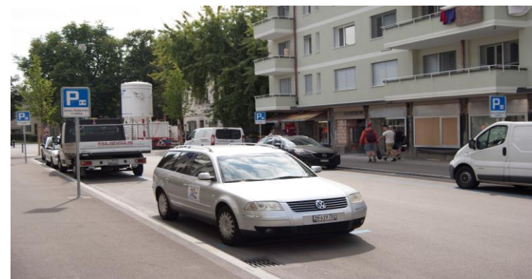
Parkfeld 4 Autos 2 Tafeln, Schützenstr.