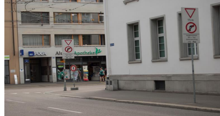
Bankstrasse 2x gleiche Tafel auf 15m