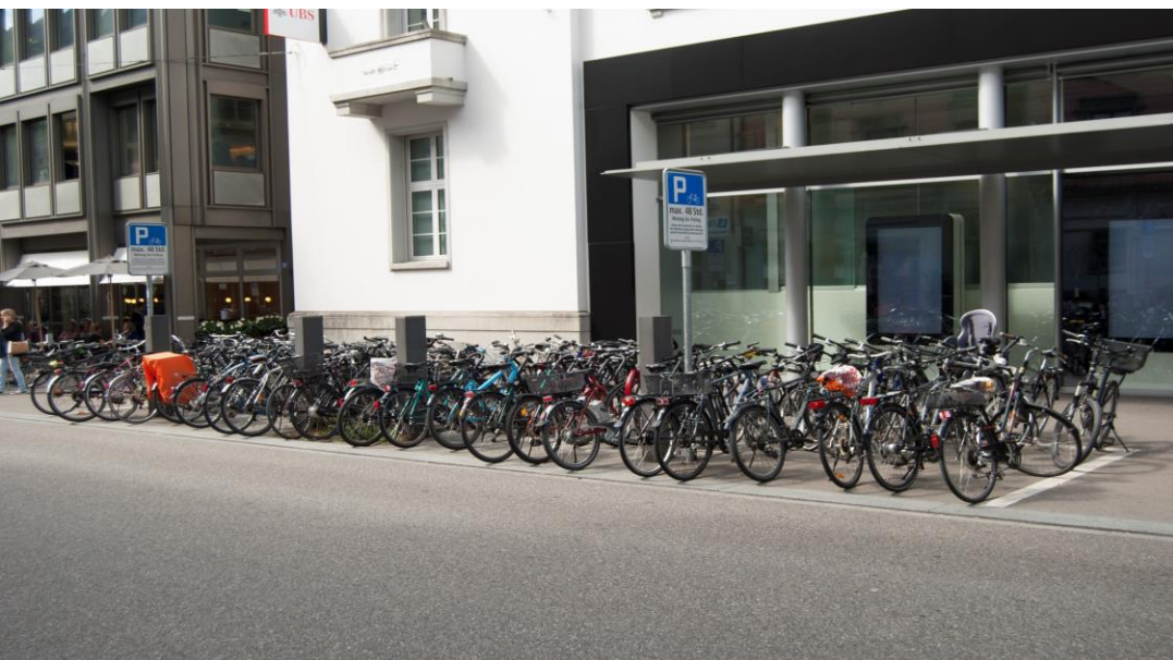
1 Velofeld = 2x die gleiche Tafel, Stadthausstrase